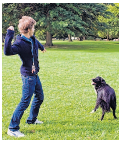
Hunde brauchen mehr Auslauf.