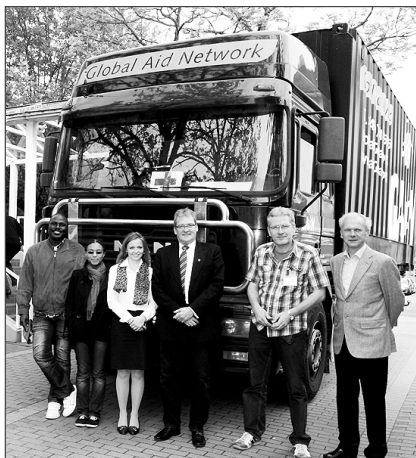
Ein großer LKW inklusive Anhänger voller ausgerangierter medizinischer Geräte sowie Krankenhaus- und Küchenausstattungen gingen gestern auf die Reise nach Togo.

Die Ziele des Vereins sind neben dem Ausbau der deutsch-togolesischen Beziehungen auf der Basis eines wissenschaftlichen und kulturellen Austauschs auch die Lieferung medizinischer Hilfsgüter an verschiedene Universitätskliniken Westafrikas, sowie